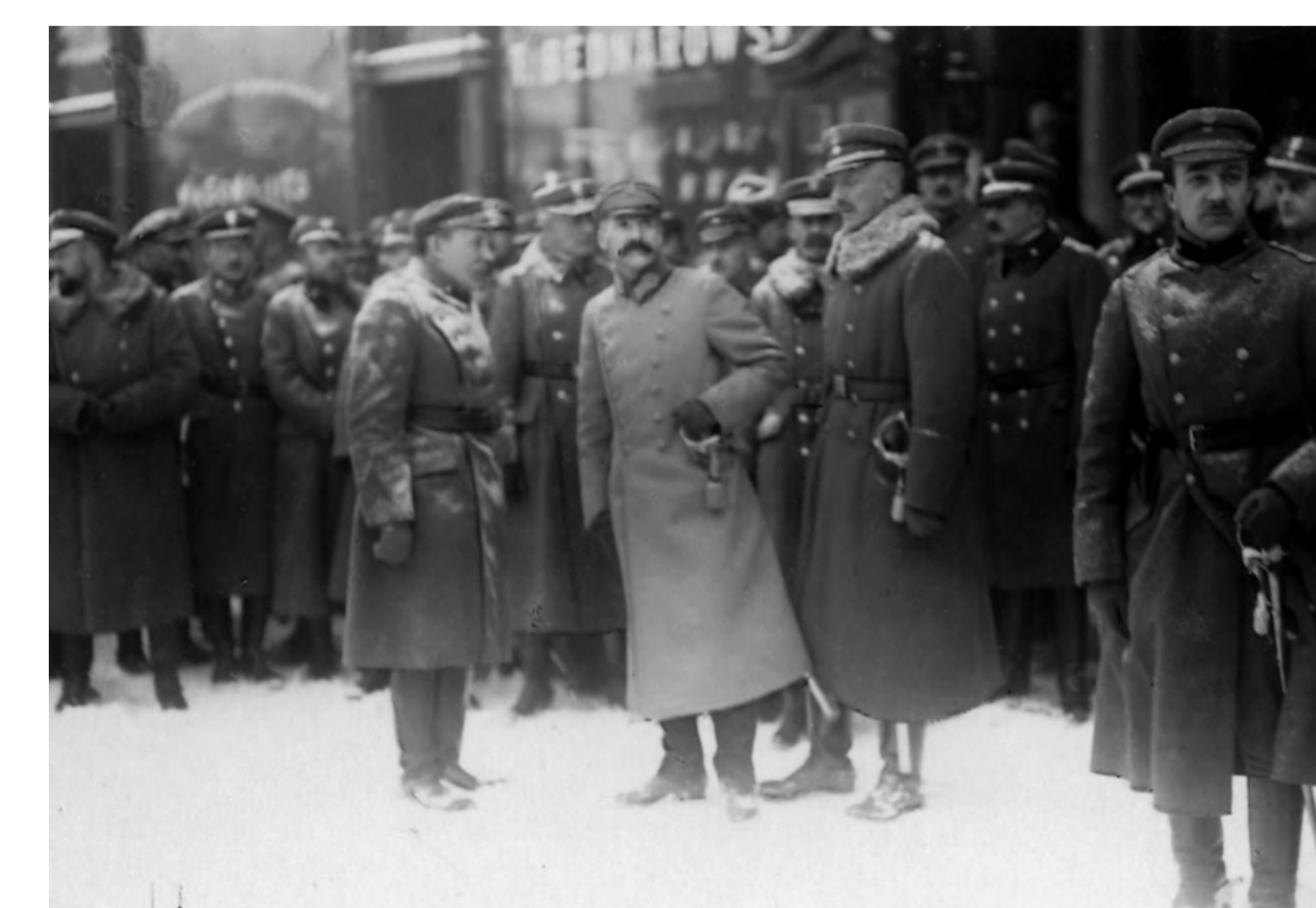
Zaprzysiężenie Wojska Polskiego, Warszawa, 1918 r.

Praca nad utrwalaniem niepodległości i wykorzeniem nawyków zniewolenia.