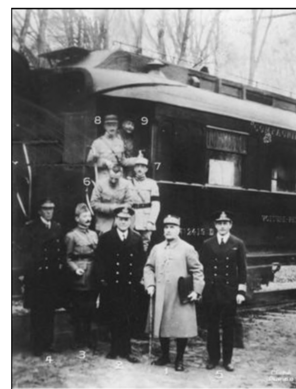
Delegacja aliantów przed wagonem sztabowym, w którym Niemcy podpisali akt kapitulacji.

Piłsudski przyjął prośbę utworzenia rządu narodowego.