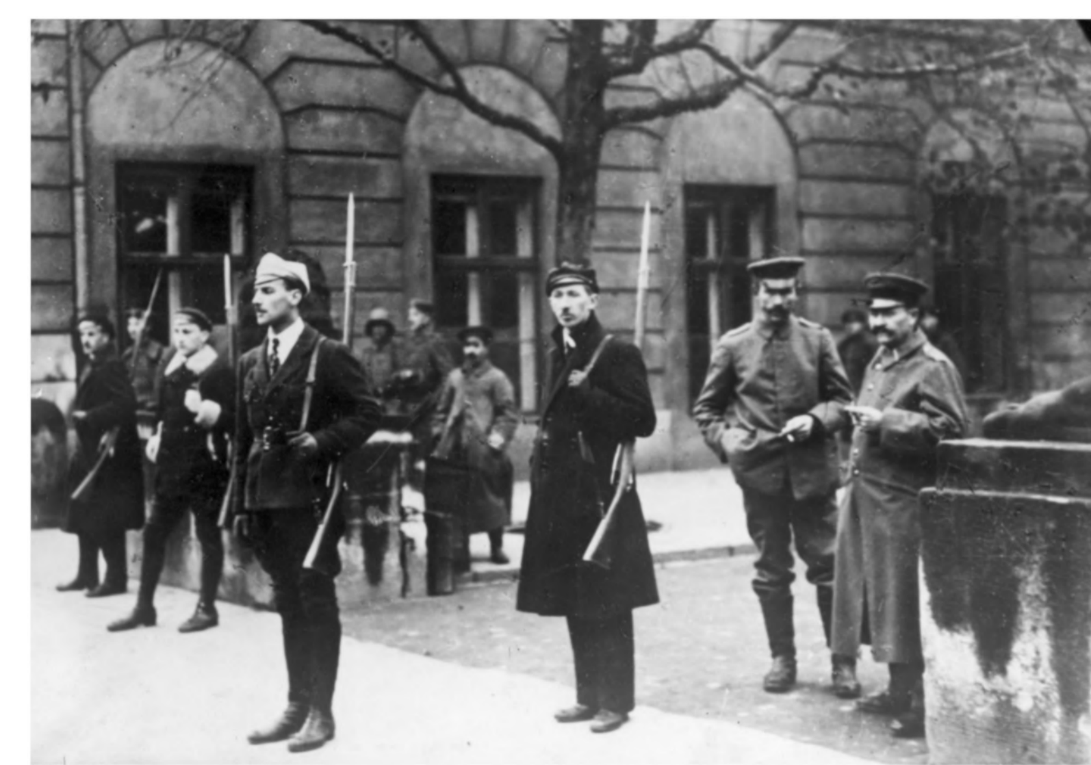
Rozbrajanie Niemców w Warszawie. W głębi widoczni rozbrojeni żołnierze niemieccy. Listopad 1918.

W Królestwie Polskim nadal działała Rada Regencyjna, ale z dnia na dzień traciła znaczenie.