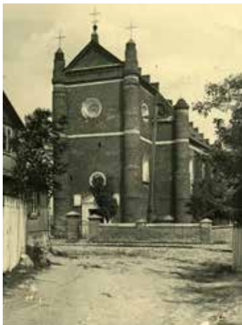
Świątynia w 1916 r.

świątyni – gotyckie wyposażenie zastąpiono barokowym.