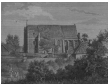
Południowa elewacja kościoła („Tygodnik Ilustrowany” 1871, nr 191, s. 3)