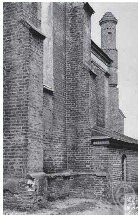
Elewacja kościoła od południa, fot. Stanisław Rakowski, 1916 r. Widoczny ślad po dobudowaniu zakrystii pod koniec XIX w. (IS PAN)

Jak można zauważyć z analizy listu ks. Franciszka Kuligowskiego kościół parafialny w Serocku przeżył wiele strasznych chwil, które groziły mu całkowitym zniszczeniem. Mimo przeciwności losu świątynia stoi nadal.