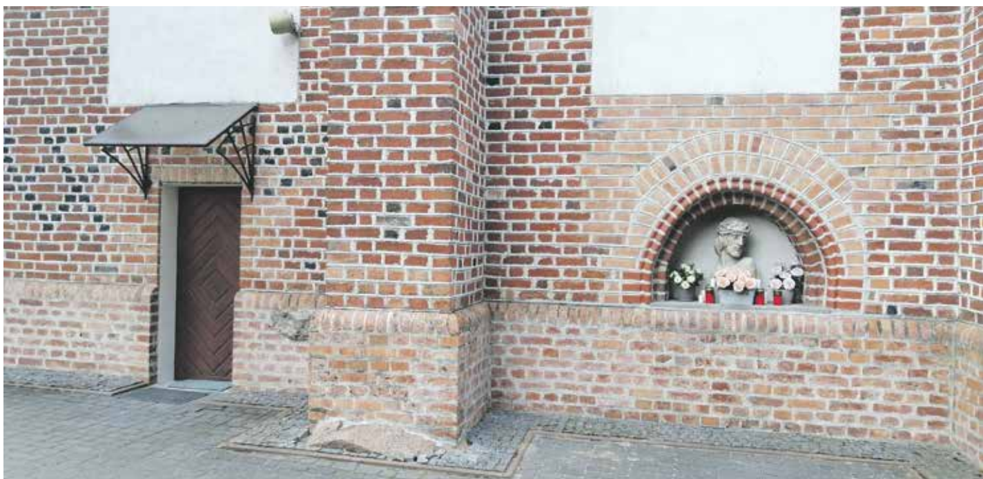
Po lewo obecne XVIII-wieczne wejście boczne, po prawo dawne wejście, które odmurował ks. Kuligowski i wstawił popiersie Jezusa Chrystusa