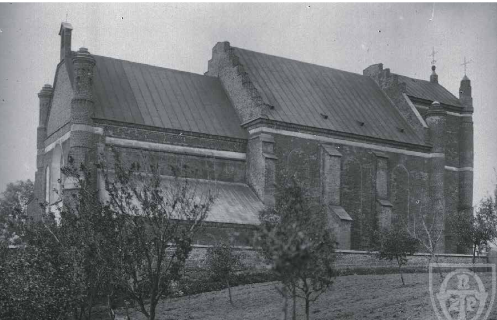
Widok na kościół od północy, Dobrze widoczne zamurowane okna jeszcze pod koniec XVIII w.