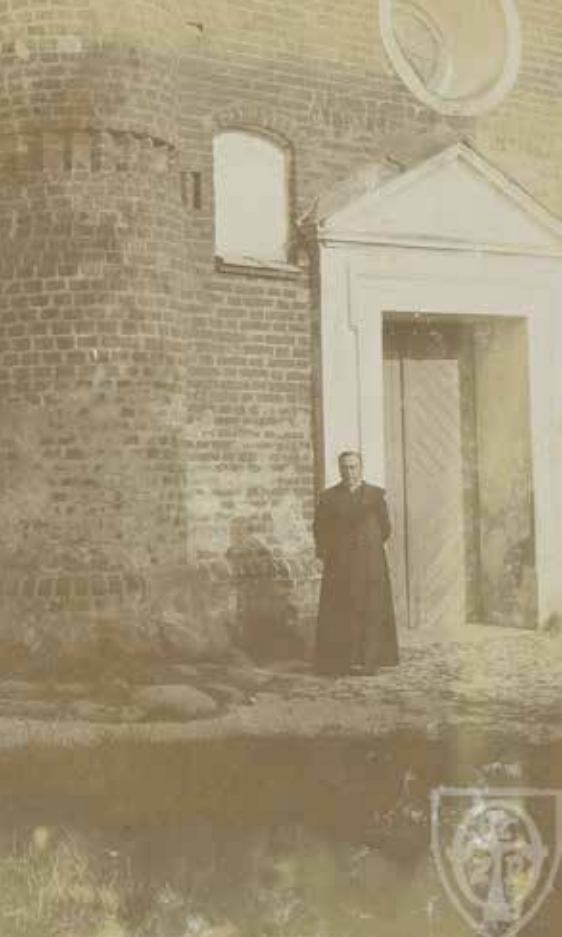
Główne wejście do kościoła, fot. Kazimierz Skórewicz, 1913 (IS PAN)

(...) restaurację kościoła gruntow[na] na którą skończył w r. 1938, kosztem prze[wa]żnie własnym 4 tysięcy złotych. Na wieży zbudowano zegar. Kościół cały pokryto dachówką rzym[ską] z Grudziądza prowadzoną. Odmurowa[no] okna zamurwane w 18-tym