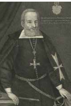
Bartłomiej Nowodworski (domena publiczna)