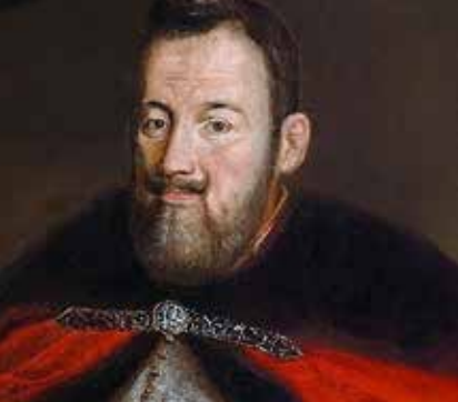
Jerzy Ossoliński