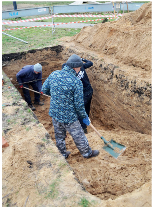
Prace wykopaliskowe prowadzone przez pracowników muzeum przy ul. Królowej Jadwigi, styczeń 2023 r.

W jednym z nich odnaleźli nieistotne pozostałości po zapleczu budowlanym osiedla „Jagiellońska” z lat 70. i 80. XX w. W drugim wykopie, pod warstwą żużla, stanowiącego nawierzchnię dawnego boiska, odsłanili warstwy zasypiskowe zawierające w sobie materiał świadczący o rozegranej tu walce pomiędzy rodziną Skonieckich a siłami niemieckimi. W warstwie sięgającej do głębokości 2,30 m odnaleziono łuski od karabinu Mauser z wybitymi datami: 1937 i 1941, pociski od tej broni, nabój pistoletu Parabellum oraz łódki karabinowe. Do ważnych znalezisk należy zaliczyć niewielki szklany znicz wyprodukowany przez firmę „Veritas Warszawa” w czasie II wojny. Prawdopodobnie został postawiony na miejscu tymczasowego grobu Skonieckich, pochowanych tuż obok domu w okresie od stycznia 1944 r. do kwietnia 1945 r. W wykopie odnaleziono elementy wyposażenia dawnego budynku, np. zawiasy, zamknięcia okienne, gwoździe, a nawet fragmenty tynku pomalowanego na czerwono, jak również przedmioty życia codziennego – sztućce oraz porcelanowy kapsel browaru