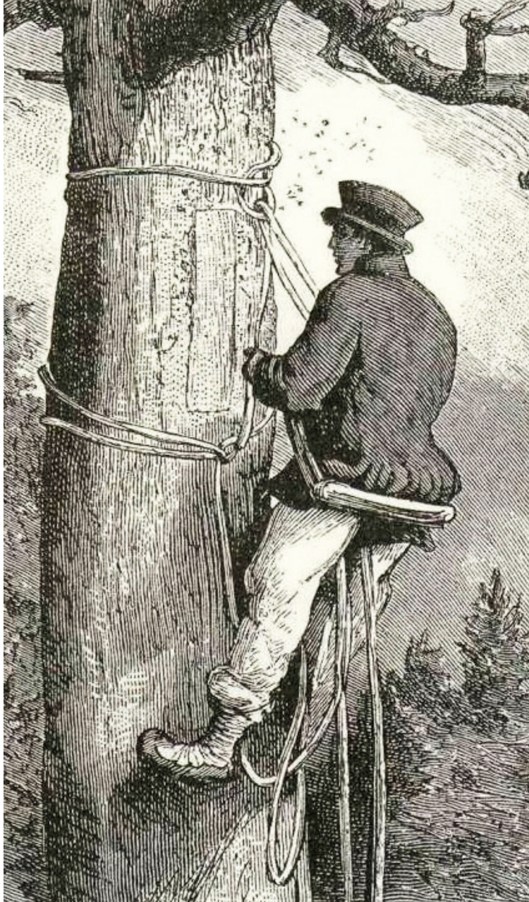
Bartnik siedzący na leziwie (Z. Gloger, Encyklopedia Staropolska Ilustrowana, Warszawa 1900-1903)

Na ograniczanie bartnictwa miało wpływ narastające zapotrzebowanie na drewno budulcowe z dorodnych drzew w lasach. Polityka państw zaborczych zakazała prowadzenia gospodarki bartnej, która ostatecznie przegrała trwającą od średniowiecza rywalizację z rozwijającym się pasiecznictwem, czyli hodowlą pszczół w ściętych kłodach bartnych, przywiezionych w pobliże gospodarstwa człowieka.