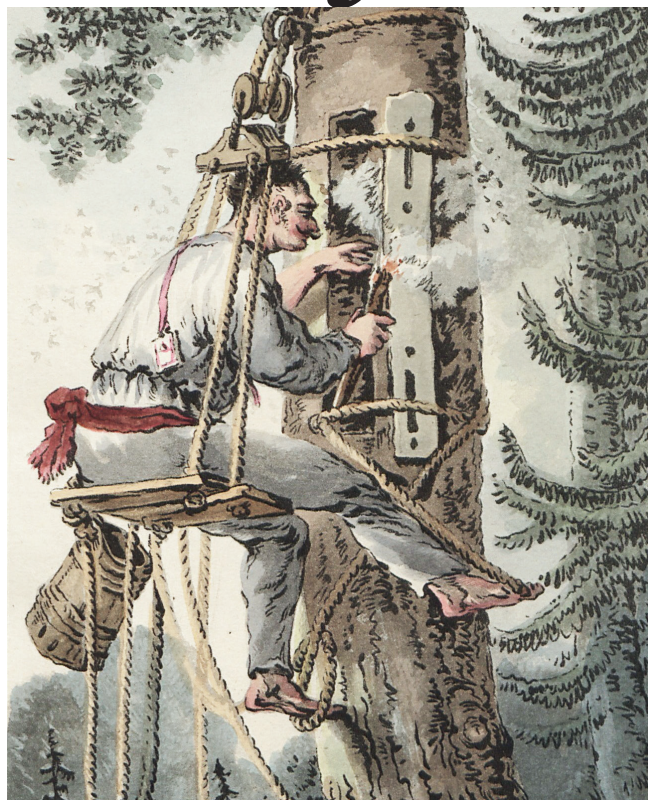
Bartnik podbierający miód, rys. Jan Piotr Norblin (Zbiór rozmaitych strojów polskich, Paryż 1817)

W prawie bartnym wymieniono też nazwy poszczególnych barci, które utworzono od nazwisk bartników z Jabłonna. Są to: barć Łempickiego, Szewczowskiej, Wójcikowska, Darczyńska, Pieńkowska, Swercowska, Kozarciowska, Packowska, Zadrożyńska, Bieńkowskiego i Wojdowska oraz pusta