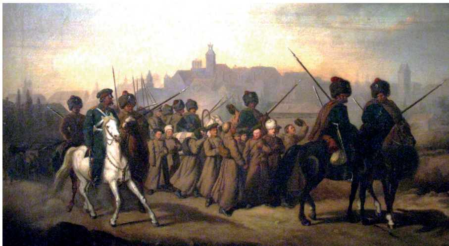
Branka Polaków do armii rosyjskiej 1863, A. Sochaczewski (Muzeum Wojska Polskiego)

Przed branką ukrywali się również mieszkańcy gminy Wieliszew. Wydział Wojskowy Rządu Gubernialnego Warszawskiego poszukiwał spi-