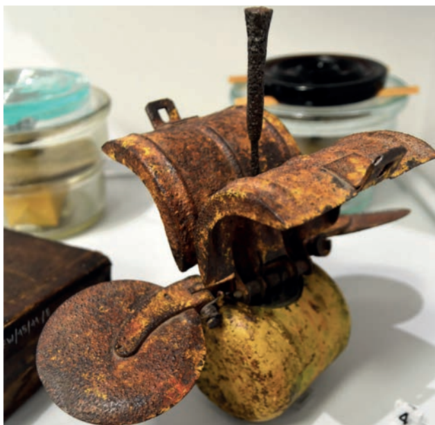
Niemiecka kasetowa bomba/mina SD-2

rów, po kilku godzinach poszukiwań wykryli i unieszkodliwili trzy miny opóźnionego działania o wielkiej sile wybuchu. Przy rozminowaniu zabudowań gospodarczych pałacu zginęło pięciu saperów. Na skrzyżowaniu dróg obok pałacu w Jabłonie, saperzy wykryli i zneutralizowali założony na głębokości 1,6 m ładunek materiału wybuchowego o wadze 330 kg, zasypyany gruzem z położonego w pobliżu uszkodzonego kościoła w Jabłonie.