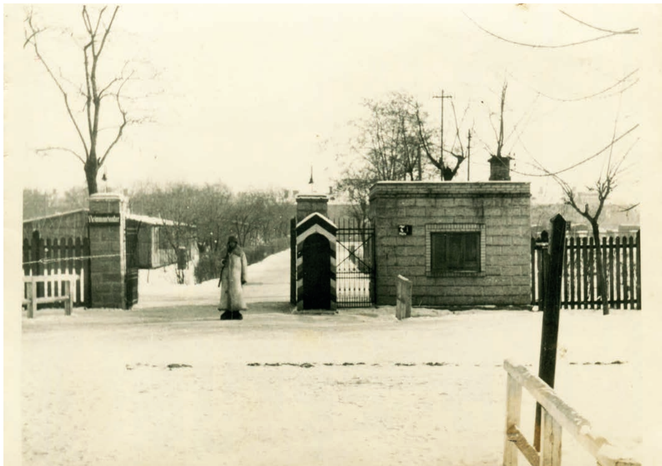
Niemiecki wartownik przed wjazdem do dawnych koszar 2. Batalionu Balonowego, ok. 1943 r..

Niemieckie zdjęcia z czasów II wojny światowej często obrazują nieistniejącą już zabudowę Legionowa. Dzięki nim możemy zajrzeć do byłych koszar 2. Batalionu Balonowego. W okresie międzywojennym nosiły one nazwę „Koszar imienia Pułkownika Aleksandra Wańkowicza” – twórcy polskich wojsk balonowych.