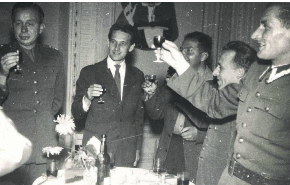
Prapremiera w Zegrzu. W środku reżyser Andrzej Wajda, po jego prawej stronie autor scenariusza Wojciech Żukrowski (kronika OSŁ 1959).

cono na polach koło Zegrzynka oraz przy dworcu Szaniawskiego. Scena ślubu podchorążego z Ewą została nakręcona w kościele w Barcicach koło Popowa Kościelnego.