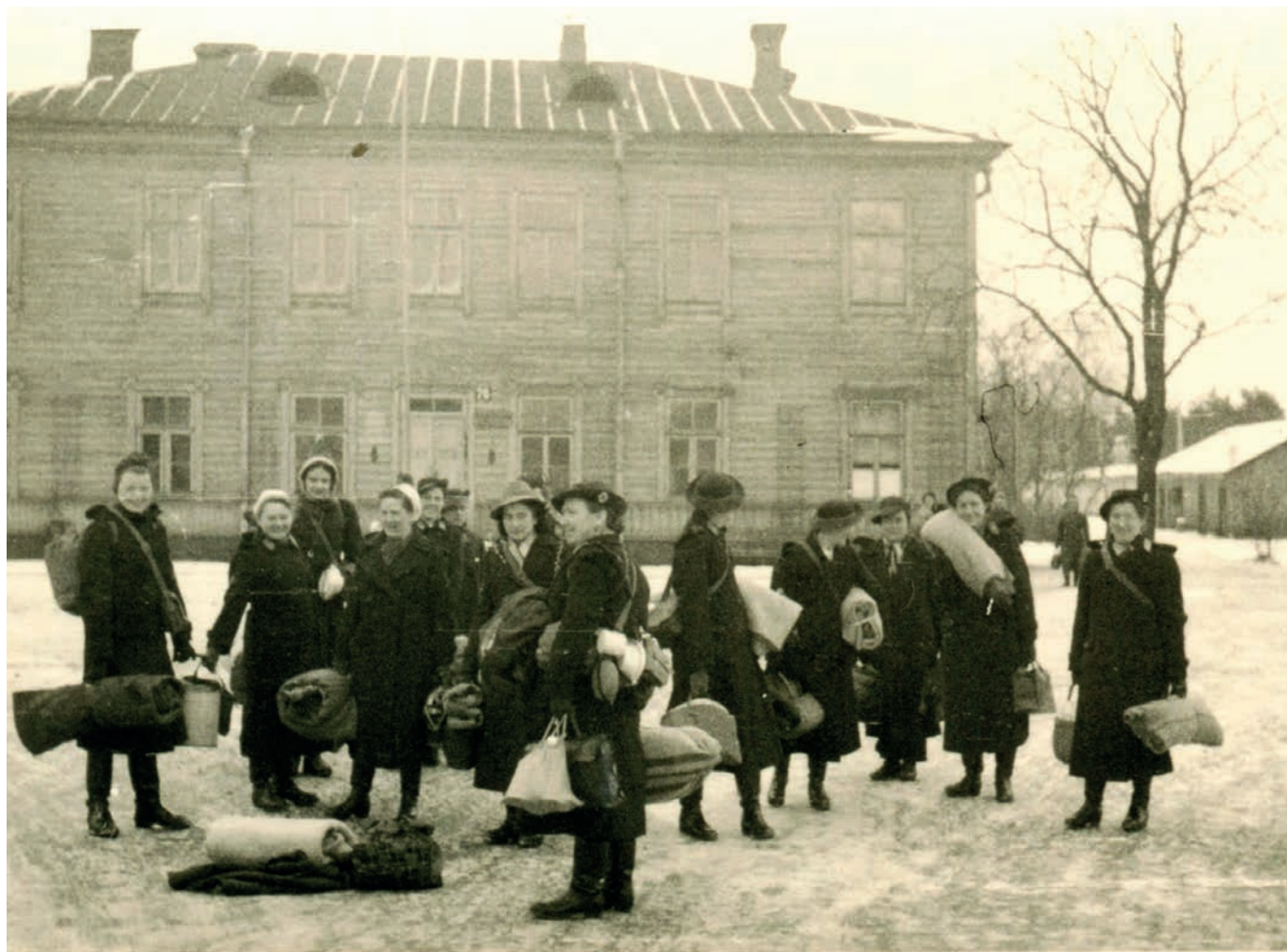
Siostry Niemieckiego Czerwonego Krzyża przed budynkiem byłego dowództwa 2. Batalionu Balonowego, 27 lutego 1942 r. (zbiory J. E. Szczepańskiego).

prof. S. Srokowski tak scharakteryzował w swoim dzienniku, w październiku 1941 r. metody postępowania żołnierzy niemieckich: Straszne obchodzenie się z jeńcami bolszewickimi w Legionowie na terenach dawnych koszar polskich, gdzie tych jeńców pracuje kilkudziesięciu. Ogromny ponton kazano 30 wygłodzonym jeńcom przenosić. Gdy, dźwigając, padali na ziemię, żołnierze podbiegli i masakrowali gumowymi pałkami leżących.