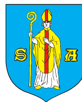
Miasto i Gmina Serock