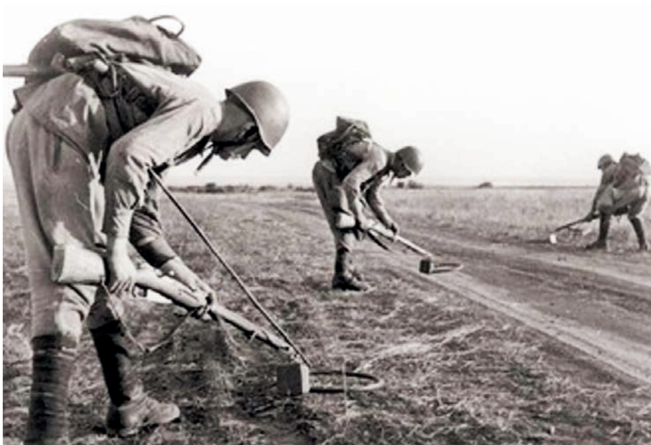
Saperzy w akcji rozminowania

Po wygaśnięciu walk toczonych z Niemcami przez jednostki Armii Radzieckiej i Wojska Polskiego latem i wczesną jesienią 1944 r., jednostki saperские 1. Armii Wojska Polskiego otrzymały zadania związane z rozminowaniem, remontami dróg oraz budową mostów. Czynności te były wykonywane także na terenie dzisiejszej gminy Nieporęt i w okolicach.