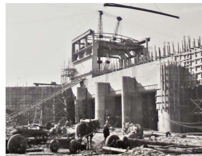
Budowa stopnia wodnego Dębe, na pierwszym planie jazy (arch. techn. „Hydroprojektu”)