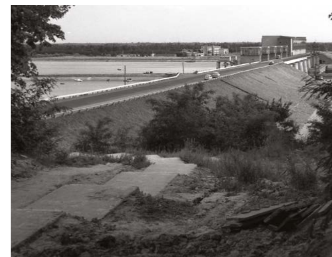
Stopień wodny po ukończeniu, 1963 r. (arch. techn. „Hydroprojektu”)