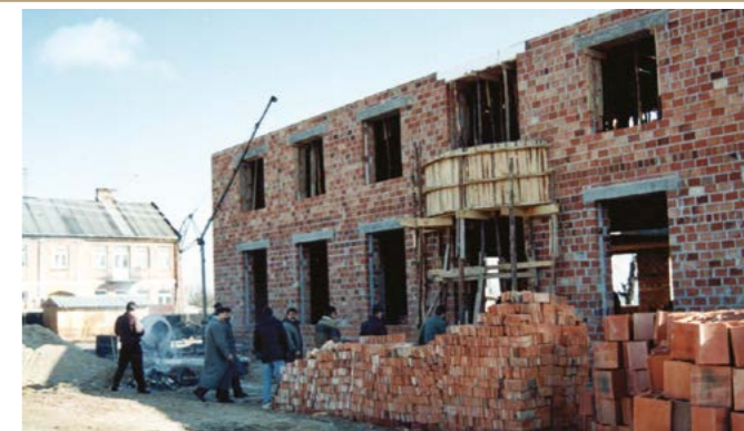
Stan budynku na wiosnę 1995 r.

W 1997 r. odbyło się uroczyste otwarcie ratusza. Przedtem siedziba władz miejskich znajdowała się w drewnianym budynku przy skrzyżowaniu ulic Pułtuskiej i Radzymińskiej a potem w tymczasowym obiekcie kontenerowym przy dzisiejszym Trakcie Księcia Janusza. Nową siedzibę zaplanowano w tradycyjnym miejscu – na Rynku. Miał powstać obiekt nawiązujący do stylu prostej architektury mazowieckiej i jednocześnie dobrze wpisujący się w zabytkowe otoczenie.