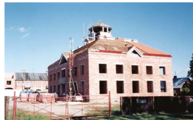
Dach ratusza prawie pokryty, wrzesień 1995 r.