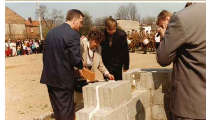
Wmurowanie Aktu Erekcyjnego, 23 kwietnia 1994 r.