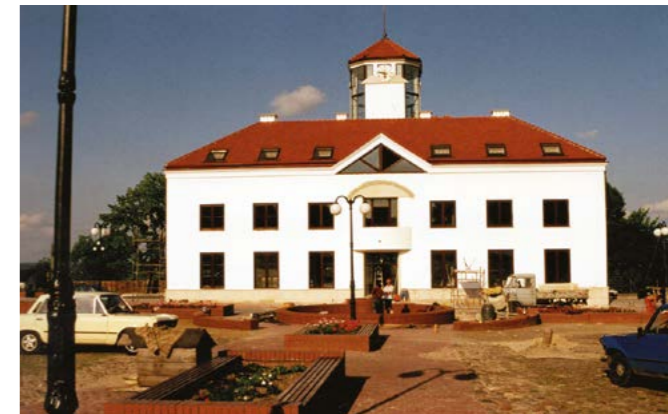
Ostatnie prace, wiosna 1997 r.