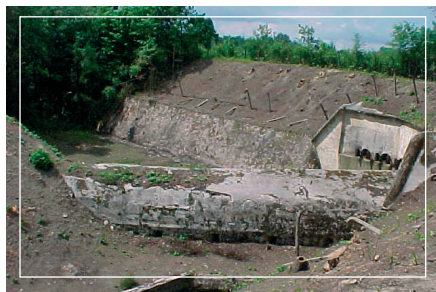
Kaponiera grodzowo-przeciwnarpowa Umocnienia Dużego

Pierwsza wzmianka o Zegrzu pochodzi z XIII w. ale to wybudowana pod koniec XIX w. carska twierdza stanowi o obecnym układzie oraz wyglądzie miejscowości. To właśnie pozostałości budowli wojskowych są, oprócz pięknego położenia nad brzegiem Zalewu Zegrzyńskiego, największą atrakcją Zegrza.