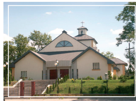
Nowy kościół garnizonowy.

Stanisławowo Ludwinowo Dębskie Ludwinowo Zegrzyńskie Zalesie Borowe Marynino Świecienica Izbiica SEROCK Wola Kiepińska Kania Polska Gąsiorowo Kania Nowa Nowa Wieś Stasi Las Zabłocie Karolino Wola Smolana Jadwisin Dębinki Guty Borowa Góra Bolestawowo Jachranka Cupel Szadki Dosin Dębe Skubianka Wierzbia Łacha