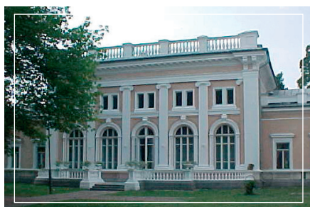
Carskie kasyno wojskowe

1. Fort >> Wycieczkę po Zegrzu zaczynamy od skrzyżowania z sygnalizacją świetlną na drodze krajowej nr 61. Po północno-zachodniej stronie szosy dostrzegamy tajemnicze wały i betonowe budowle. Są to elementy jednego z fortów rosyjskiej twierdzy z XIX w. – tzw. Umocnienia Dużego. Zwiedzanie fortyfikacji nie jest niestety możliwe, jednak warto spacerować się przy samym ogrodzeniu, równoległym do drogi gruntowej wiodącej w kierunku Dosina. Na odcinku ok. 200 m. zobaczymy kolejno głęboką suchą fosę wysadzaną od strony zewnętrznej kamieniami polnymi, betonowy trytytor oraz na końcu prostego odcinka ogrodzenia, szczególnie atrakcyjną, doskonale zachowaną kaponierę grodzowo-przeciwnarpową.