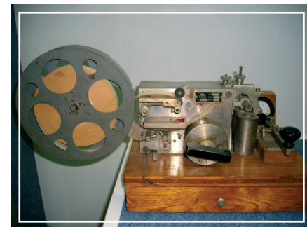
Telegraf Morse'a w Sali Tradycji CS&I.

6. Kościół garnizonowy >> Wychodząc z dziedzińca pałacu przez bramę znajdującą się od strony zachodniej, udajemy się ulicą Groszkowskiego w kierunku osiedla. Po prawej stronie mijamy otoczoną ogródkami działkowymi legendarną „górkę głodową” – prawdopodobnie sztuczny obiekt uroczający kiedyś park Krasieńskich. Po przejściu około stu metrów, po lewej stronie dostrzegamy kościół garnizonowy. Dochodzimy do niego ulicą Drewnowskiego biegnącą w dół, w kierunku Zalewu. Świątynia została zbudowana w latach 1998-2006 (2007 – konsekracja). Na jej miejscu istniał wcześniej kilka kościołów wybudowanych w XIV w., 1580 r., 1756 r., 1890 r. (cerkiew), 1919 r. (adaptacja na kościół katolicki) i w latach 30. XX w. (przebudowa).