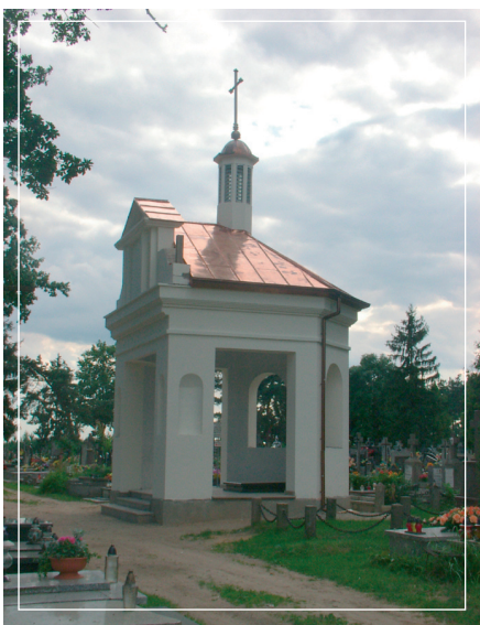
Kaplica p.w. bł. ks. Romana Archutowskiego na cmentarzu parafialnym

Wola Kiełpińska i Wola Smolana prawdopodobnie stanowiły w przeszłości jedną wieś. Tuż obok znajdują się Szadki. Miejscowości położone są w pobliżu drogi krajowej nr 62. Tysiące kierowców przejeżdżających przez Wolę Kiełpińską dostrzegają przy szosie piękny neobarokowy kościół. To serce okolicy. Warto zatrzymać się i oddać pod opiekę św. Antoniego z Padwy, patrona parafii.