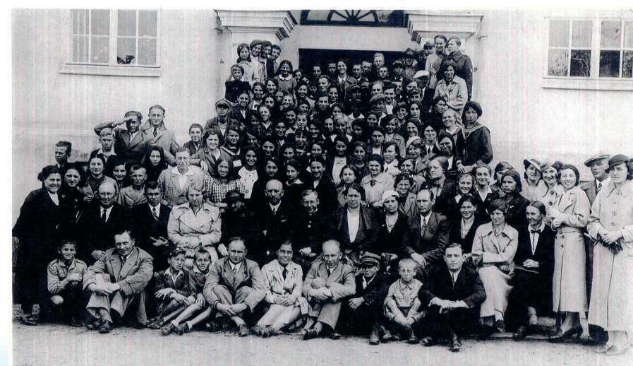
Zdjęcie szkolne 1938 r.