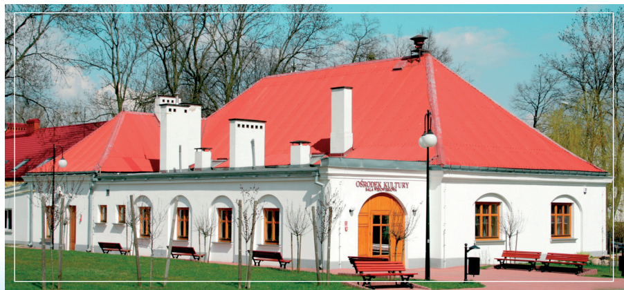
Sala widowiskowa Ośrodka Kultury

Bydnyki wybudowane zostały w latach 1824 – 1828. Dawniej mieściły się tu m.in. stajnie, przetrzymywane były też konie, bryczki, karety oraz sanie i sanki do obsługi przejazdów członków rodziny carskiej.