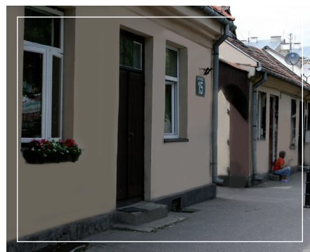
Dawny zajazd pocztowy z I poł. XIX wieku.

4. Dawny zajazd pocztowy >> Spacer kontynuujemy w kierunku południowym, czyli podążając całą czas ulicą Pułtuską. Tuż za przejściem dla pieszych, po prawej stronie znajduje się Osiedle Nowy Świat, wybudowane jako pierwsza w inwestycji mieszkaniowych w gminie Serock po reformie samorządowej. Kilkadziesiąt metrów dalej znajduje się zespół budynków dawnego zajazdu pocztowego, których historia sięga czasów napoleońskich.