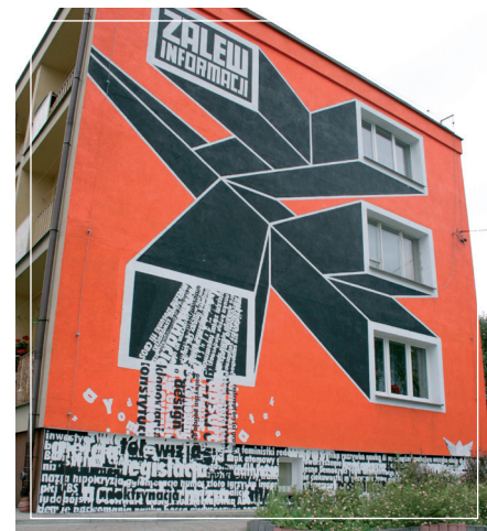
Mural wykonany na jednym z bloków przy ul. Pułtuskiej w 2008 roku przez Grupę Twożywo