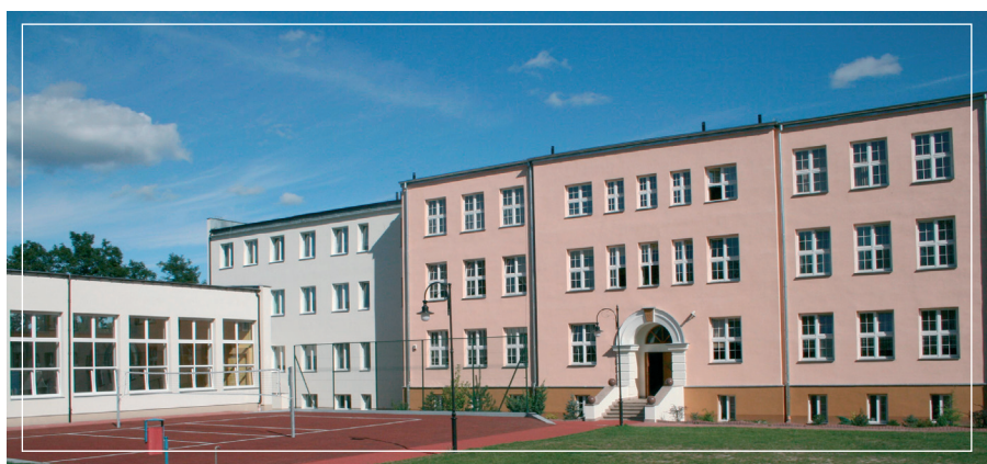
Zabytkowy budynek szkoły podstawowej w Serocku

Serocki ratusz, który został oddany do użytku w 1997 roku, wpisał się w zabytkowy układ urbanistyczny miasta i jest jego wizytówką. Fontanna, ławki, kwiaty, studzienki – elementy małej architektury tworzą malownicze tło serockiego rynku. Tutaj właśnie rozpoczniemy drugą wycieczkę po Serocku.