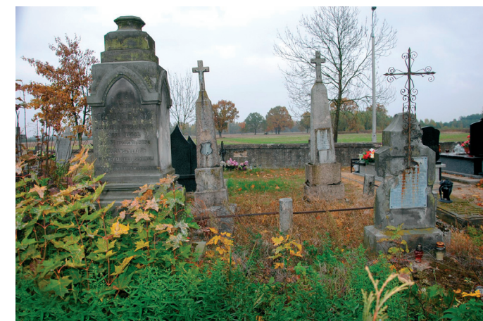
Część cmentarza z nagrobkami z początku XX w.