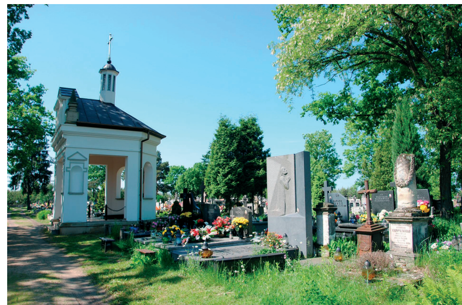
Kaplica z sąsiadującymi grobami m.in. Sutkowskich