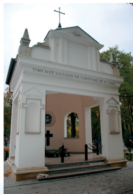
Kaplica im. bł. ks. Romana Archutowskiego