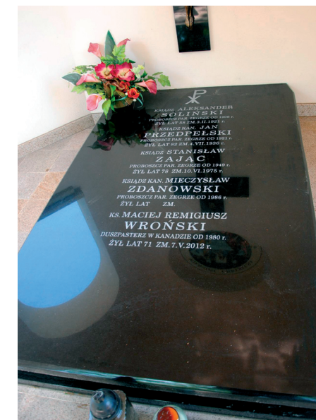
Płyta wewnątrz kaplicy z nazwiskami księży