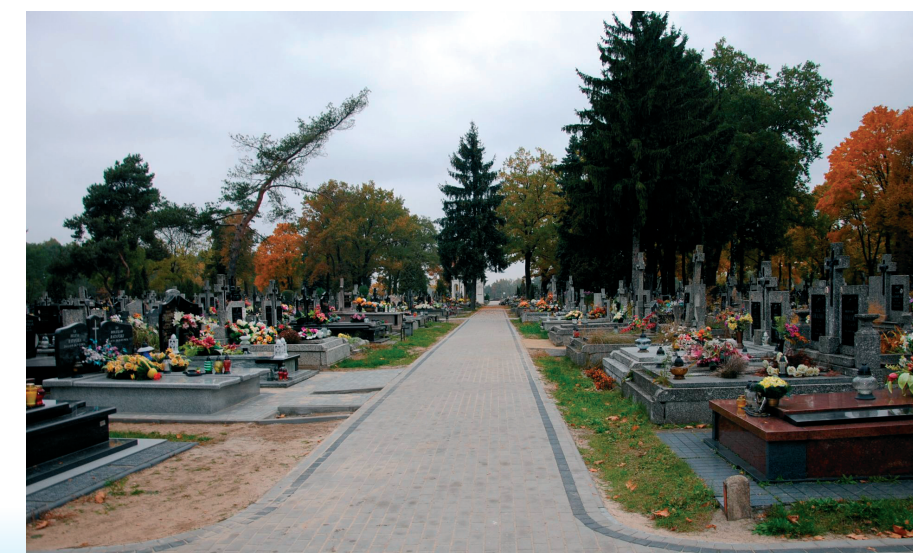
Główna aleja od strony zachodniej