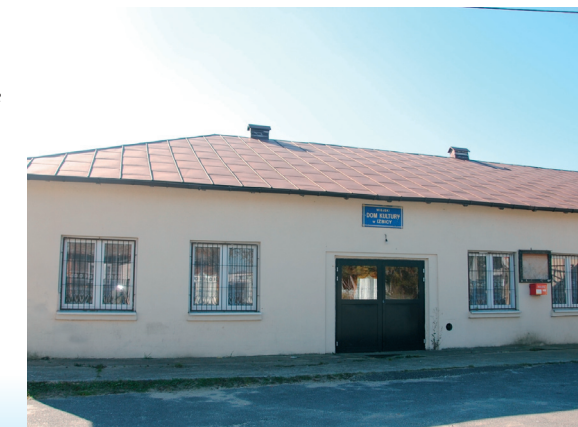
Wiejski Dom Kultury