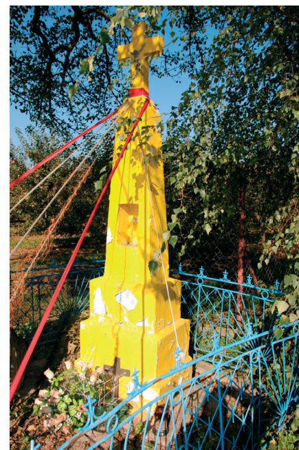
Kapliczka z początku XX w.