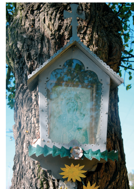
Mała kapliczka na drzewie

piero tu wkładano ciało na wóz lub karawan. Mała skrzynkowa kapliczka z obrazem Matki Boskiej Częstochowskiej, zawieszona na stojącym obok drzewie, wzmacnia dodatkowo kultowy charakter miejsca.