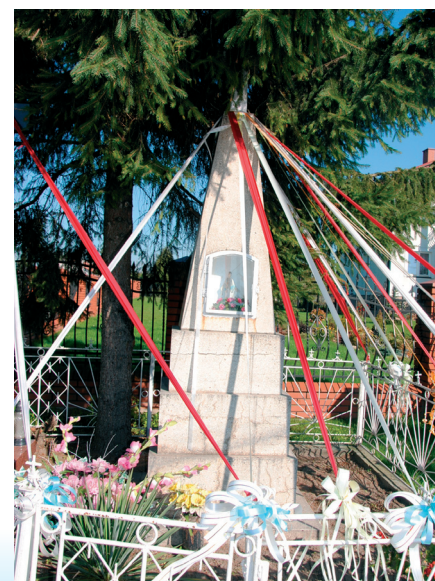
Kapliczka w centrum wsi

1. Kapliczka z początku XX w. przy skrzyżowaniu drogi Dębe-Zegrze z drogą Izbica –Wola Kiełpińska. Powstała zapewne po przeniesieniu siedziby parafii z Zegrza do Woli Kiełpińskiej. Znajdowała się wtedy na krańcu wsi i zmarłych mieszkańców odprowadzano pieszo do niej i do-