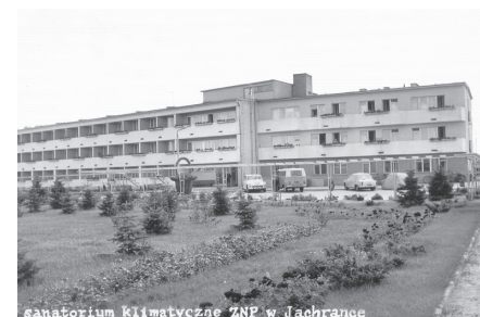
Sanatorium ZNP na pocztówce z 1973 r.