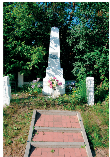
Kapliczka przy ulicy Zegrzyńskiej z 1923 r.

W wyniku działań wojennych jesienią 1944 r. wieś została zniszczona w 100 %, ale mieszkańców było dość dużo – 314 osób w 1945 r. Nie było tu dużych gospodarstw, dlatego nie było tu walki z kułakami, chociaż część rolników była karana za niewywiązywanie się z obowiązkowych dostaw.