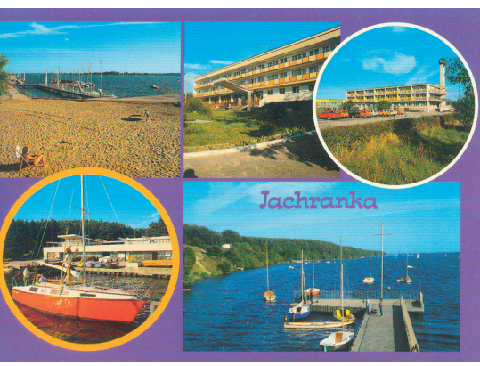
Pocztówka z 1988 r. z najważniejszymi ośrodkami wypoczynkowymi ZNP, Kolejarz i GUS