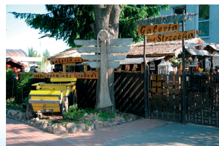
Galeria Pod Strzechą

kawiarnię, klub nocny, Aquapark oraz Yacht Club. Ze względu na niewielką odległość od Warszawy często na wyjazdowych posiedzeniach spotkają się tu politycy głównych partii: PO i PiS. Ostatnio, jako swoją bazę pobytową, wybrała ten hotel reprezentacja Grecji, uczestnicząca w EURO 2012.