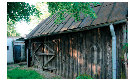
Stara stodoła przy ul. Zegrzyńskiej