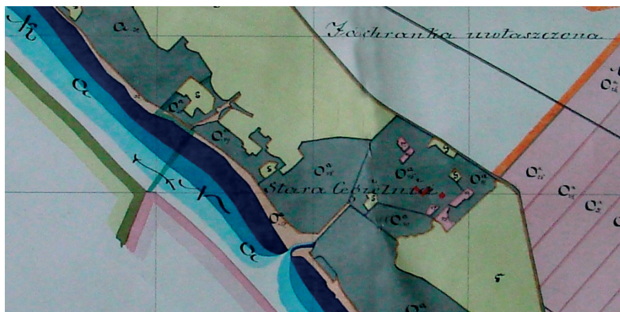
Cegielnia w Jachrance na mapie z XIX w.

W drugiej połowie lat 70. XX wieku działały tu również Ochotnicze Hufce Pracy dla chłopców i dziewcząt.