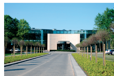
Warszawianka główne wejście