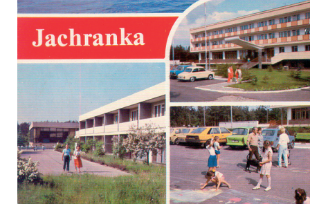
Pocztówka z 1985 r. z najważniejszymi ośrodkami wypoczynkowymi ZNP, Kolejarz i GUS

W Jachrance Nowej też można znaleźć kilka starych domów oraz kapliczkę z II połowy XX w. przy drodze do Woli Kiepińskiej.