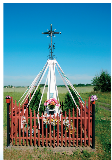
Kapliczka w Jachrance Nowej