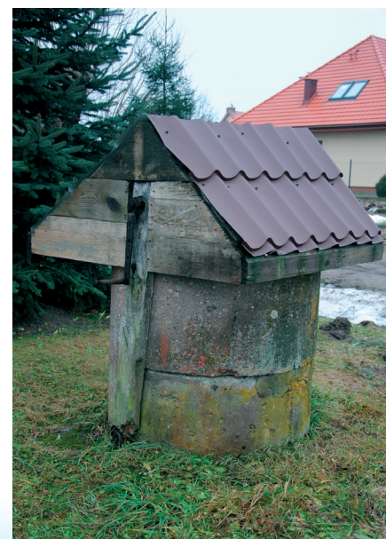
Stara studnia koło pp. Srebników

W latach 60 - tych XX wieku w gospodarstwie pisarza Jerzego Szaniawskiego w Zegrzynku, pracowała przez prawie rok rodzina Krzemińskich z Dębinek.