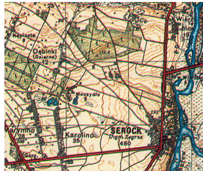
Dębinki na mapie 1936 r.