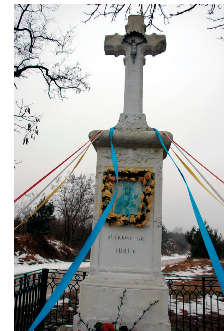
Kapliczka z 1881 r. jedna z najstarszych w gminie