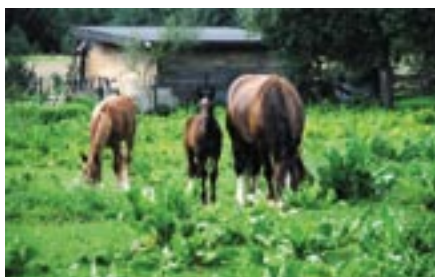
Konie Józefa Tyskiego