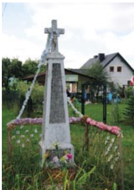
Kapliczka przydrożna w Zalesiu Borowym z poł. XX w.