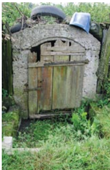
Wejście do starej piwnicy

wsie „ villae nobilium propriae culturae ”, których właściciele z reguły nie posiadali poddanych chłopów, gospodarując jedynie z pomocą czeladzi. W 1576 r. w Zalesiu podatek był opłacany tylko z 1 i ¼ łana (nawet jeśli był to tzw. łan duży, to Zalesie miało wówczas powierzchnię zaledwie 30 ha), podczas gdy w Zabłociu z 8 łanów, Jaskułowa z 5 łanów, Popowa Borowego z 4 łanów i Wólki Zaleskiej z 1,5 łana.