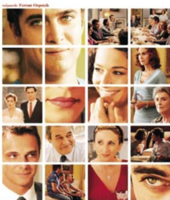
Najnowsza komedia twórcy „Saturno Centros. Poł dobrą gwiazdą” i „Okna”