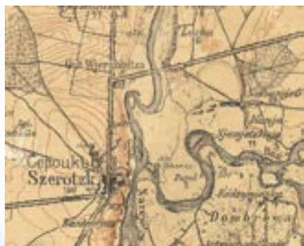
Mapa z 1916 r.

Nazwa wsi pisana była częściej jako Cypel , dopiero z czasem przeważała wersja Cupel , mimo iż niewątpliwie właściwsza była pierwsza wersja. Aleksander Bruckner