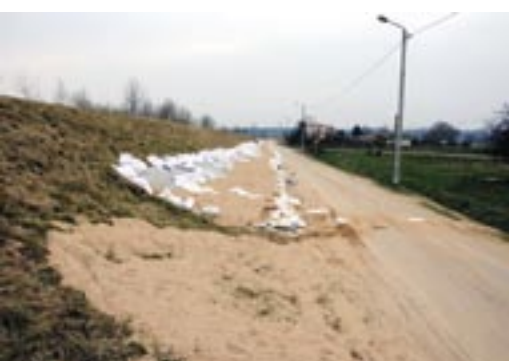
Umocnienie wałów przeciwpowodziowych 2011 r.

Miejscowość narażona stale na powódzie i potopienia nigdy nie miała zbyt wielu stałych mieszkańców. Część łąk na jej terenie należała do gospodarzy z sąsiednich wsi Łąchy i Nowej Wsi, które na początku XIX wieku były na nowo zagospodarowane przez niemieckich kolonistów wyznania ewangelicko-augsburskiego. W zapisach ar-