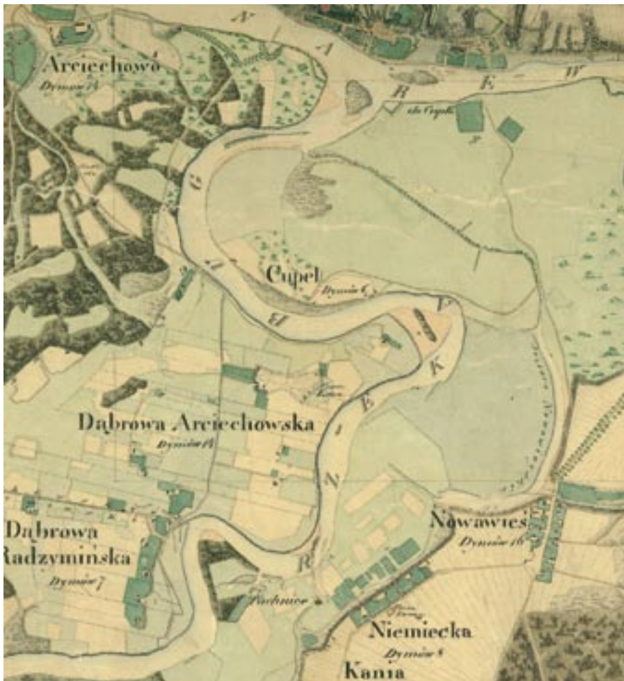
Cupel na mapie z I połowy XIX w.

W trakcie budowy twierdzy napoleońskiej w Serocku, w latach 1807-1810, powstało na Cuplu niewielkie umocnienie ziemne, swego rodzaju przedmoście. Widać je zarówno na mapie z 1824 r., jak i na niemieckiej mapie z 1916 r. pod nazwą Alte Schanze. Z budową tych umocnień można wiązać etymologię nazwy Budy Skrzyżki, gdyż technologia budowy wałów opierała się na drewnianym szkieletcie mającym formę wielkich skrzyń.