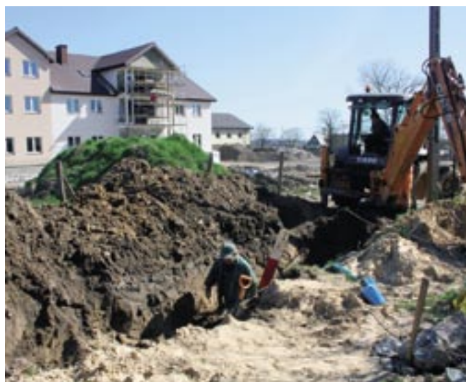
Budowa wodociągu w ul. Zacisze w Serocku