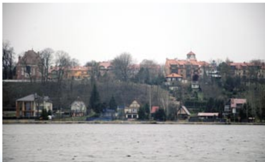
Widok na Serock z wałów na Cuplu