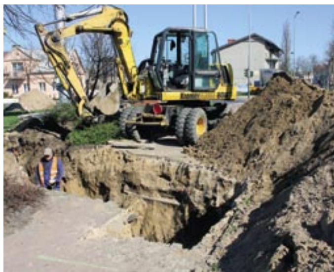
Budowa wodociągu w ul. Pułtuskiej w Serocku