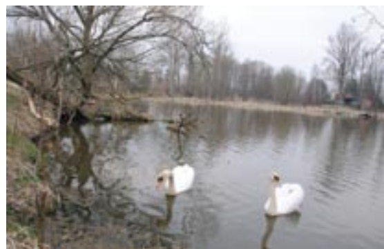
Łabędzie pływające w starym korycie Bugu