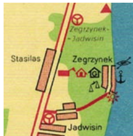
Fragm. mapy turystycznej z 1966 r.

Zatrudnionym tam ponad 50 robotnikom i rzemieślnikom, oprócz stałej pensji, zapewniano samodzielne mieszkanie, opał, bezpłatną opiekę lekarską i leki oraz szkołę dla ich dzieci. Obcy woźnice, przywożący furmankami zboże do młyna, w urzędzonej izbie gościnnej, mogli poczytać wyłożone specjalnie dla nich pisma ludowe, takie jak „Gazeta