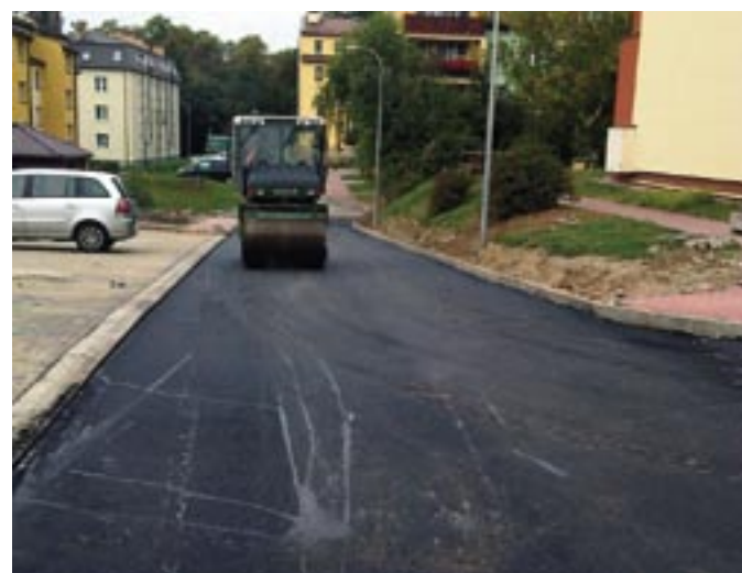
Przebudowa drogi wraz z budową parkingu w Zegrzu przy ul. Drewnowskiego

Niebawem zakończymy realizację inwestycji polegającej na przebudowie drogi wraz z budową parkingu w Zegrzu przy ul. Drewnowskiego. Wykonano już chodnik i zatoki parkingowe z kostki betono-