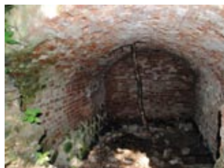
Piwnica magazynu przy młynie