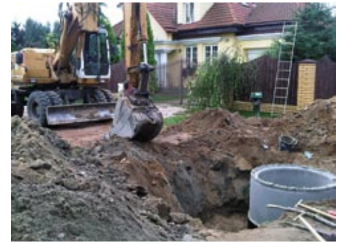
Budowa kanalizacji sanitarnej w ulicy Okrężnej i Dojazdowej w Jadwisinie