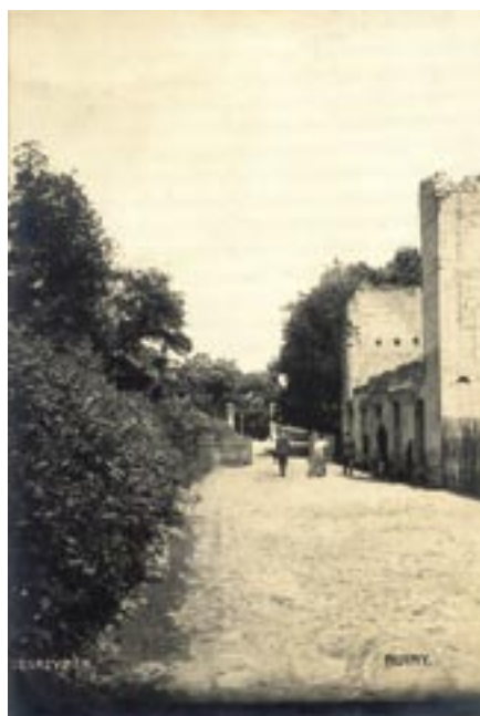
Ruiny młyna na pocztówce wysłanej w 1910 r. z Serocka do Londynu