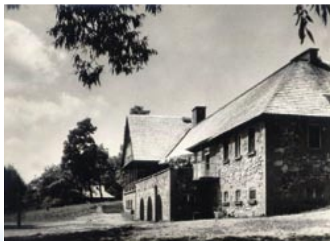
Hotel PTTK na pocztówce z 1961 r.