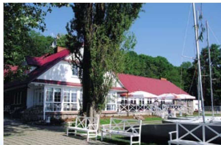
Przystań żeglarska w Klubie Miła.