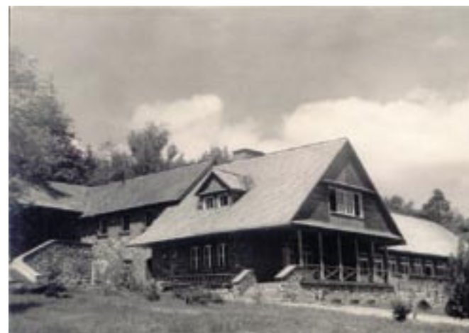
Hotel PTTK na pocztówce z 1962 r.