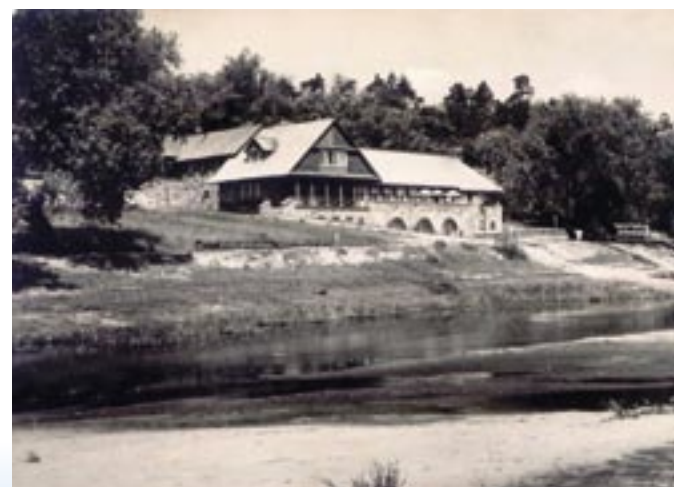
Hotel PTTK na pocztówce z 1961 r.

Najważniejsza była jednak inicjatywa utworzenia obowiązkowej szkoły dla dzieci pracowników młyna,