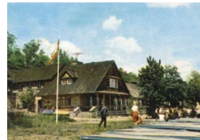
PTTK na pocztówce z 1966 r.