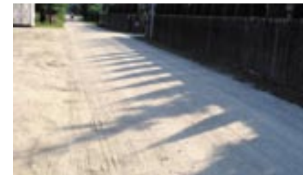
Referat Przygotowania i Realizacji Inwestycji

Rozpoczyna się budowa sieci wodociągowej w Borowej Górze. Prace prowadzone będą na ulicach: Lipowa, Nasielska, Poprzeczna, Długa. Zostanie wykonane prawie 3 tys. metrów sieci oraz 2 tys. metrów przyłączy wodociągowych. Planowany termin zakończenia robót wyznaczony jest na 30.04.2014 r.