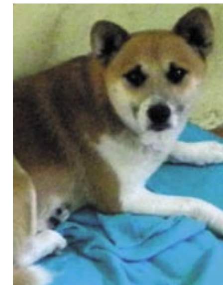
Pies Burek. Odłowiony w dniu 10 lipca 2014 r. w Nowej Wsi na ulicy Piaskowej. Ma ok. 4 lata, jest średniej wielkości.

Osoby zainteresowane prosimy o kontakt z Referatem Ochrony Środowiska, Rolnictwa i Leśnictwa, (tel: 22 782 88 39 i 22 782 88 40), Strażą Miejską w Serocku (tel 22 782 88 33, 603 873 290) lub bezpośrednio ze Schroniskiem (tel: 23 693 04 45, 660 277 648).