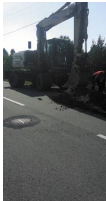
Budowa wodociągu w Dębie

Referat Przygotowania i Realizacji Inwestycji