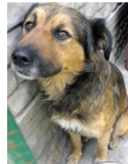
Pies Glon. Odłowiony 2 sierpnia 2014 r. w Dosinie, przy ulicy Oliwkowej 2. Ma ok. 3 lata, jest duży.