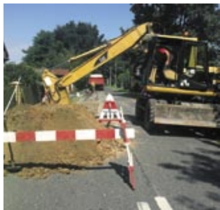
Budowa wodociągu Wola Kiełpińska - Szadki

W dniu 29 lipca 2014 roku gmina Serock podpisała umowę z Samorządem Województwa Mazowieckiego z siedzibą w Warszawie na dofinansowanie rozbudowy sieci wodno - kanalizacyjnej na terenie gminy Serock w miejscowości Dębe, Wola Kiełpińska - Szadki, Jadwisin w ramach działania „Podstawowe usługi dla gospodarki i ludności wiejskiej” objętego Programem Rozwoju Obszarów Wiejskich 2007-2013. Kwota dofinansowania to 50% kosztów kwalifikowanych. Inwestycje objęte dofinansowaniem to: