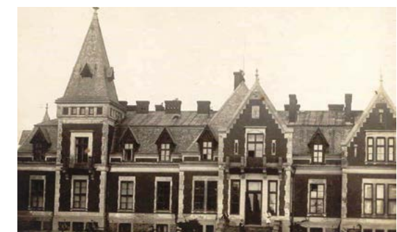
Pałac w Jadwisinie - pocztówka

W 1893 r. jako jeden z pierwszych pośpieszył na ratunek płonącemu Serockowi, a w okresie walki o język polskich w szkole i urzędach wspierał protestujących nie tylko swoją obecnością.