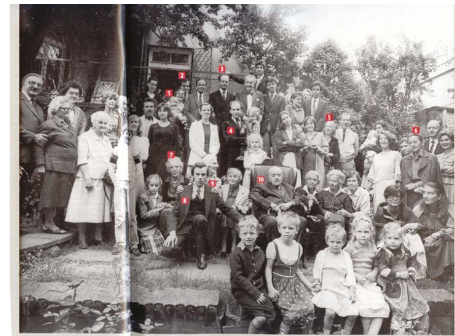
Radziwiłłowie (nr 4 Konstanty Radziwiłł - Minister Zdrowia, nr 6 Anna Radziwiłł - wiceminister edukacji w rządzie Tadeusza Mazowieckiego)