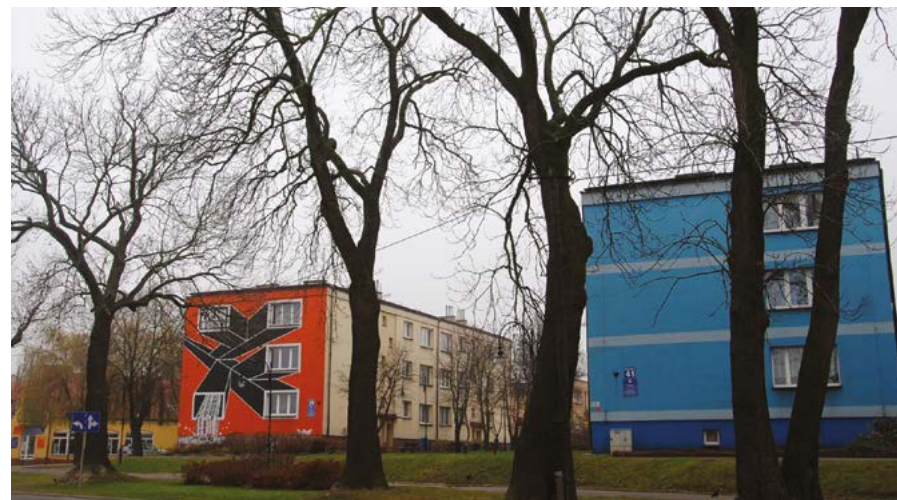
Bloki Osiedla 1000-lecia