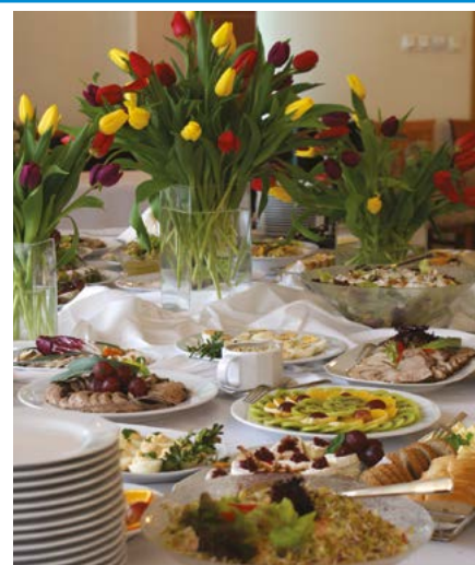
W czasie Sesji Rady Powiatu Legionowskiego, 18 marca br. w Serocku, autorami wielkanocnego poczęstunku były osoby z warsztatu gastronomicznego CIS w Legionowie.