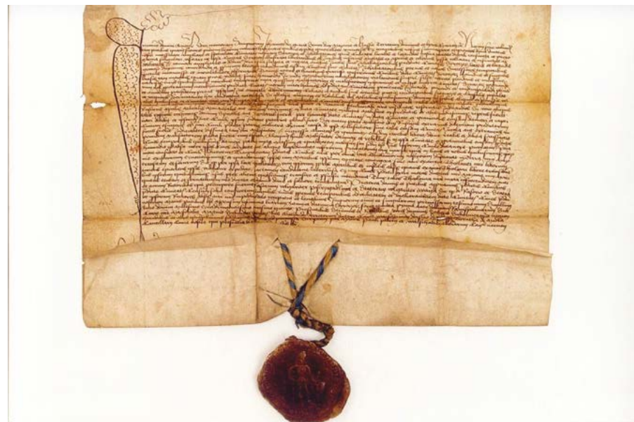
Dokument księcia Janusza z 1425 r. nadanie praw miejskich

Uchwałami: Rady Państwa z 22 lutego i Sejmu z 25 lutego 1958 r. postanowiono w latach 1960-1966 uroczystie obchodzić 1000-lecia państwa polskiego. Obchody miały „pomnożyć siły naszego narodu dla budowy socjalizmu i umocnić PRL”. Planowano budowę 1000 szkół, sadzenie miliona drzew, zakładanie parków, wydanie publikacji naukowych i popularyzatorskich. Ważnym elementem miało być połączenie tych obchodów z uroczystościami jubileuszowymi poszczególnych miast, „stanowiąc ważny czynnik pogłębiania patriotyzmu”. Nie przewidywano żadnych wspólnych uroczystości z Kościołem. Władze komunistycznej Polski w 1966 r. nie wyraziły zgody na przyjazd, na uroczystości w Gnieźnie i Poznaniu papieża Pawła VI, a I sekretarz PZPR Władysław Gomułka skrytykował prymasa Wyszyńskiego i kościelną koncepcję obchodów chrztu Polski. Władze „aresztowały” również kopię obrazu Matki Boskiej Częstochowskiej, która odwiedzała polskie parafie w ramach obchodu 1000-lecia chrztu Polski.