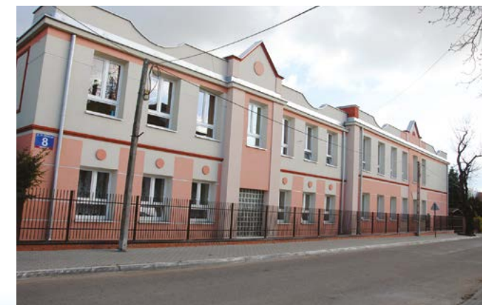
Zespół szkół noszących imię Włodzimierza Wolskiego, przy ul. Wolskiego