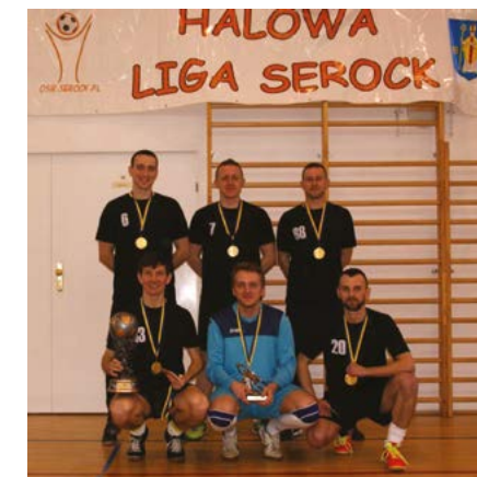
Luxtorpedy – 1 miejsce w Halowej Lidze Serock w sezonie 2015/2016

Drużyna Fair Play: Uksiaki Król strzelców HLS: Kacper Oleś – 101 goli (Młode Wilki) Najlepszy bramkarz HLS: Artur Stróżewski (Luxtorpedy) Szczegółowe statystyki ligi dostępne są na stronie internetowej rozgrywek: www.ligaserock.futbolowo.pl