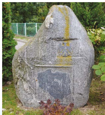
Kamień na 1000-lecie