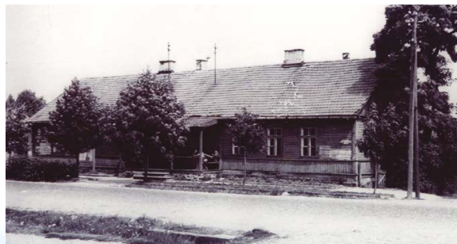
Budynek prezydium Miejskiej Rady Narodowej