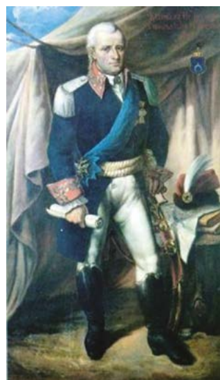
Portret Kazimierza Krasinskiego (w zbiorach Muzeum Narodowego w Warszawie)