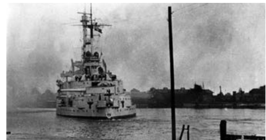
Okręt „Schleswig Holstein” podczas ostrzału Westerplatte. 01.09.1939 r.

Źródło (18.09.2018): https://www.dzieje.pl/aktualnosci/wybuch-ii-wojny-swiatowej