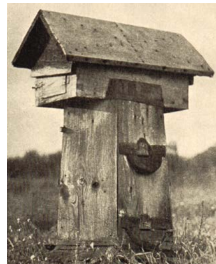
Kłoda z Gnojna

Pierwsza połowa XIX w. przyniosła prawie całkowity upadek bartnictwa. Wynikało to z dwóch względów. zakazu uprawiania bartnictwa w lasach rządowych ze względu na ochronę lasów oraz rozwoju przemysłu cukrowniczego. Sytuację poprawiło pojawienie się w drugiej połowie XIX w. fachowego piśmiennictwa propagującego bardziej racjonalne, dochodowe metody hodowli pszczół. Przyjmuje się, że przeciętna wydajność jednego ula w połowie XIX w. wynosiła 4-4,5 kg miodu.