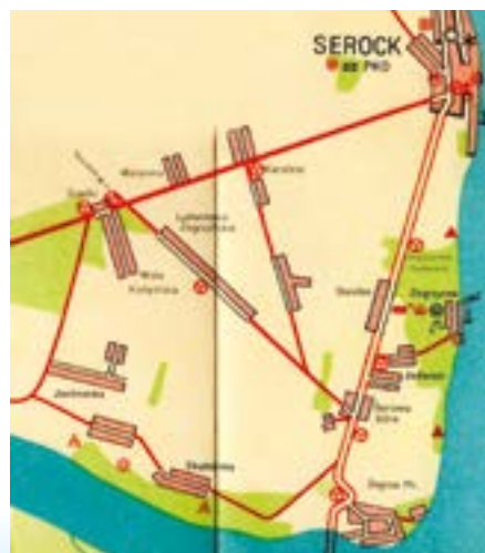
Fragment mapy turystycznej z 1966 r.