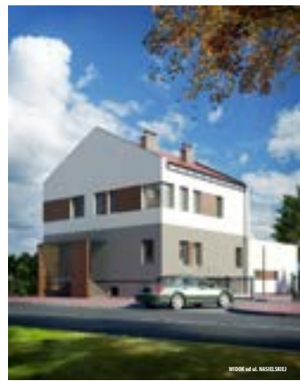
STACJA UZDATNIANIA WODY W SEROCKU przy ul. NASIELSKIEJ