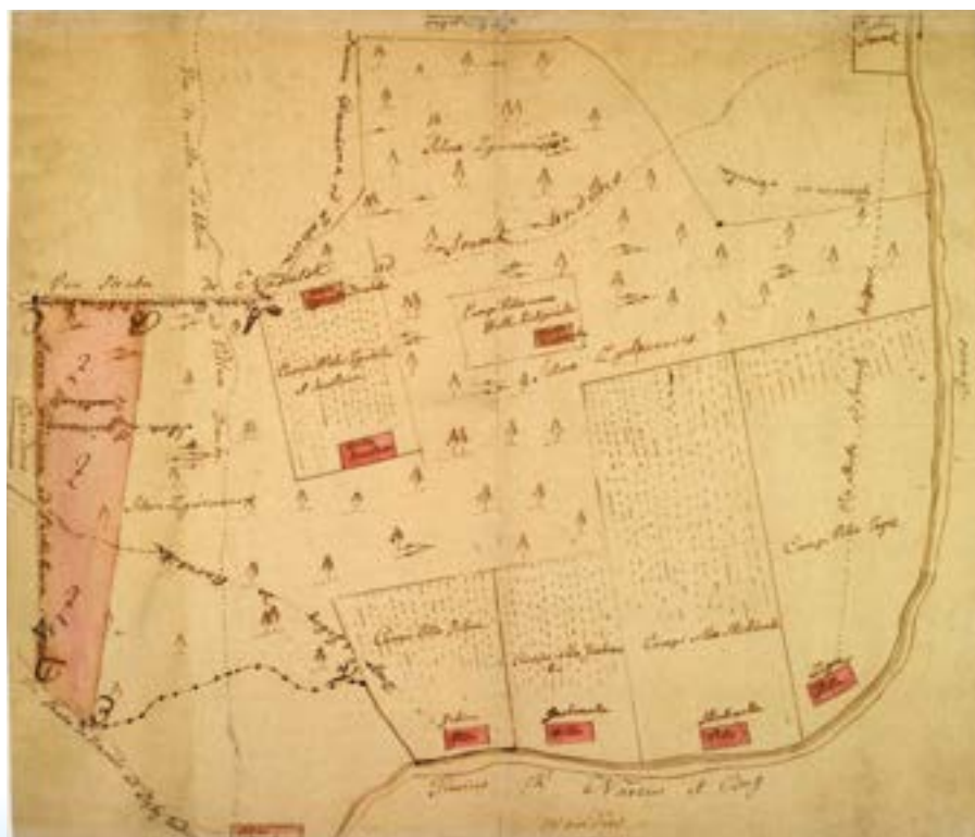
Mapa dóbr zegrzyńskich 1803 r. (AGAD)