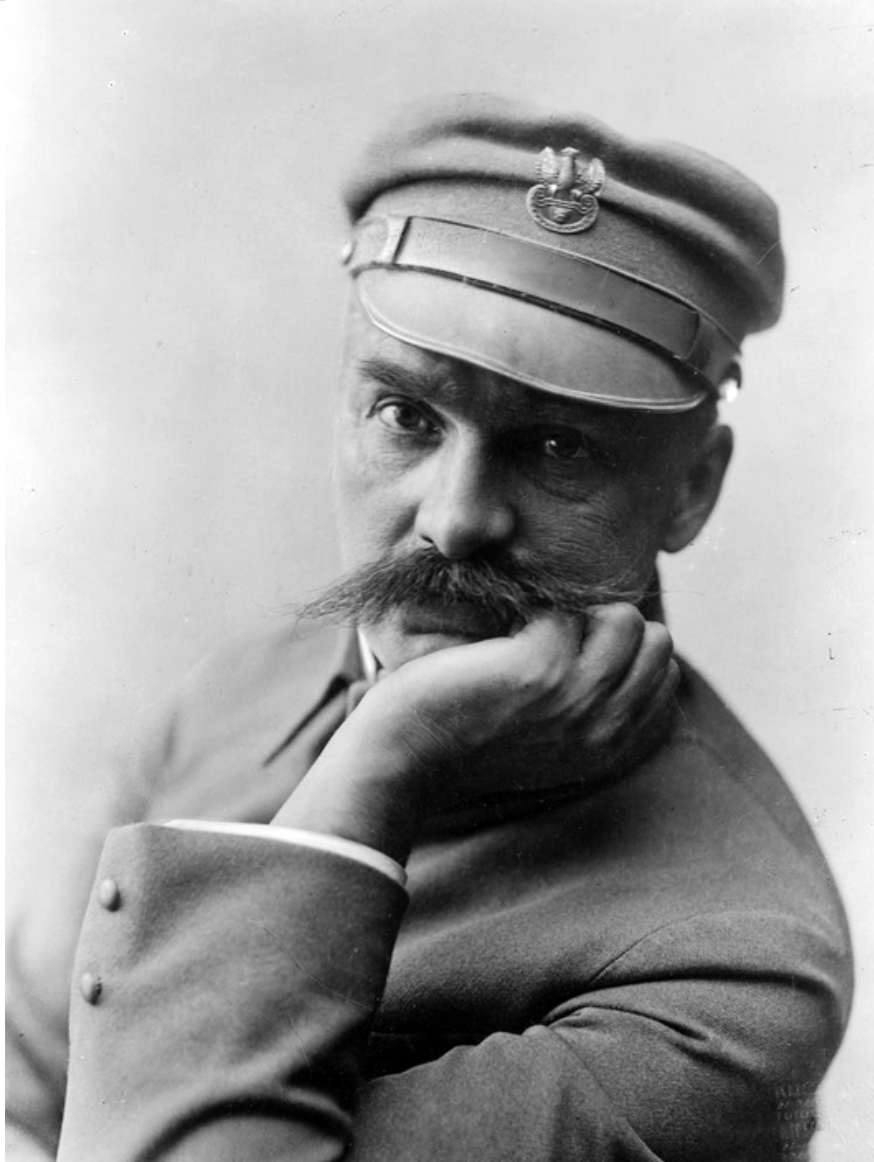
Józef Piłsudski - twórca Legionów i komendant 1. Brygady

Legioniści okazali się doborowymi żołnierzami. Austriacy posyłali ich na najtrudniejsze odcinki frontu. Polacy bili Rosjan odważnie i skutecznie. Do historii przeszły sławne bitwy: pod Łowczówkiem (22-25 grudnia 1914 r.),