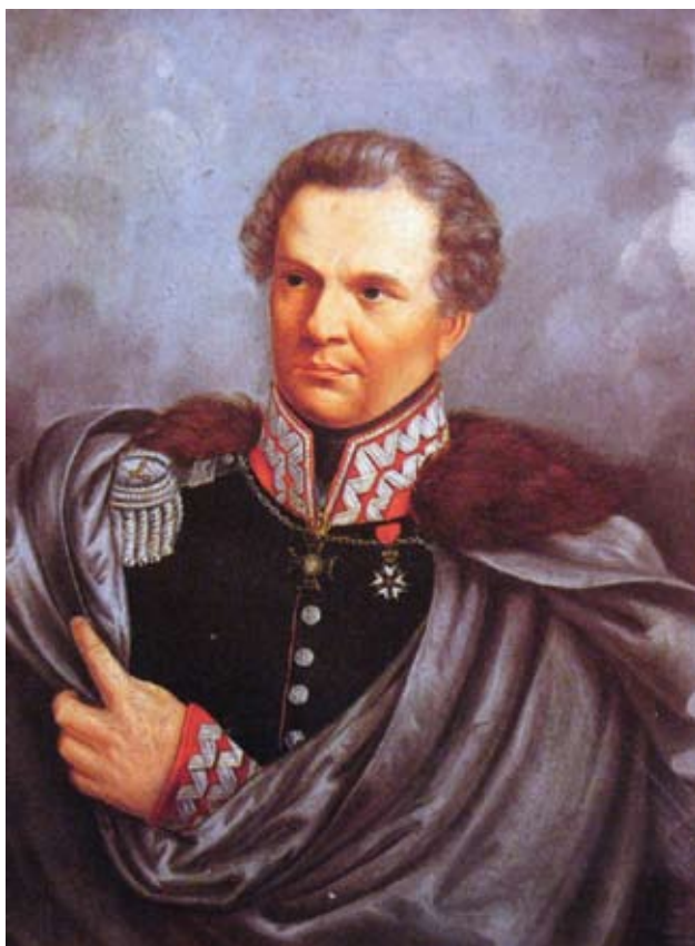
Gen. Jan Skrzynecki, głównodowodzący w wyprawie na gwardie, która ruszyła z Serocka