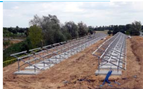
Dawne składowisko odpadów w Tarnogrodzie zabudowywane instalacją fotowoltaiczną.

zawsze było wiele, ale w ostatnich latach zaobserwowaliśmy ich znaczny wzrost. Jasnym się stało, że trzeba szukać rozwiązania, dzięki któremu zatrzymamy kierowanie każdego wyłapanego psa wprost do schroniska. Stanowiło to problem, bo czas na odnalezienie właściciela na miejscu, tj. na terenie gminy, był bardzo krótki, liczony zaledwie w godzinach. Potem zwierzę kierowane było do schroniska i pomimo, że jego zdjęcie z opisem umieszczane było na stronie internetowej gminy, właściciel znajdował się niezwykle rzadko. Zbyt krótki był to także czas, aby znaleźć zwierzęciu nowego właściciela.