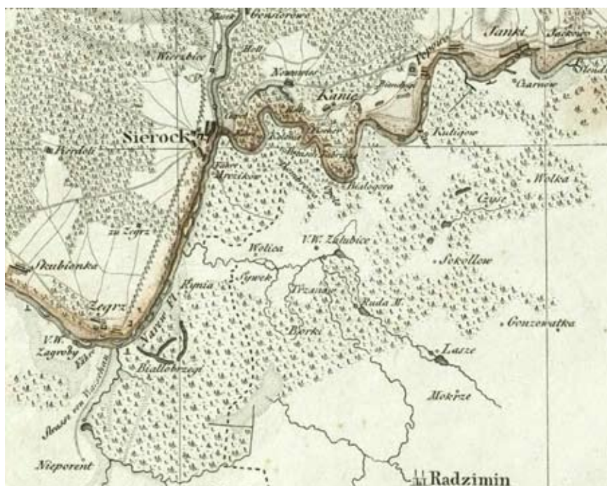
Okolice Zegrza i Serocka na początku XIX w. - fragment mapy

12 maja 1831 r. oddziały polskie ruszyły w kierunku Serocka. Dwa dni później, na obszarze między Zegrzem a Serockiem, zebrano ponad 40 tys. polskich żołnierzy (4 dywizje piechoty, 14 pułków jazdy i 96 dział). Armia została podzielona na trzy kolumny i wyruszyła 15 maja. Grupa gen. Tomasza Łubieńskiego (prawe skrzydło sił polskich) ruszyła jak pierwsza, przeszła przez most w Serocku i pomaszerowała wzdłuż Bugu przez Wyszków do Broku. Druga grupa pod dowództwem gen.