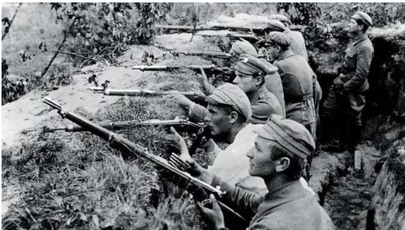
Bitwa pod Kostuchówką (4-6 lipca 1916 r.) - największy i najkrwawszy bój legionistów

które zostały w większości zbojkotowane przez legionistów (poza żołnierzami 2. Brygady i 2. Pułku Ułanów).