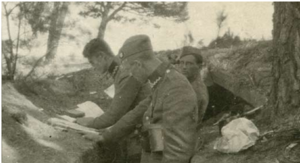
Punkt obserwacyjny polskiej artylerii w okolicach Serocka (Instytut Polski i Muzeum im. gen. Sikorskiego w Londynie)

Dębego, Woli Kiełpińskiej i Karolina - zostali odparci. Nieskuteczne ataki trwały cały dzień.