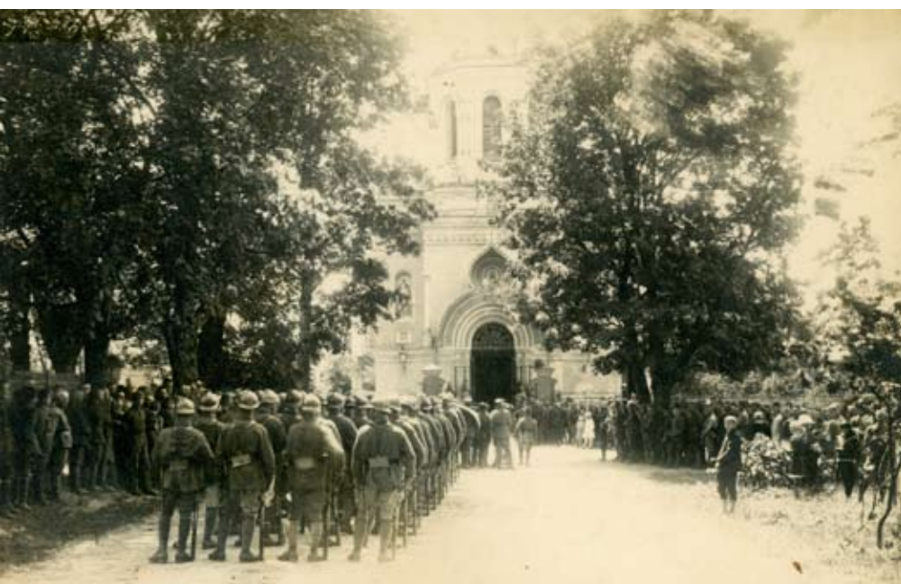
Żołnierze polscy przed kościołem (dawną cerkwią) w Zegrzu, sierpień 1920 r.