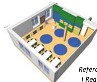
Referat Przygotowania i Realizacji Inwestycji

Wymienione powyżej zadania nie wyczerpują oczywiście planów inwestycyjnych na nowy rok - stanowią jedynie zapowiedź tego, co będzie się działo w sferze inwestycji aż do późniejszej jesieni.