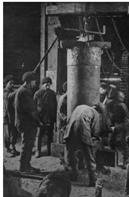
Prace przy wydobyciu ropy naftowej w Baku, koniec XIX w.

W testamencie spisanim na kilka dni przed śmiercią, dochody z roponośnej działki zapisał nie tylko dla bliskich ale też na cele dobroczynne. Najważniejszym punktem testamentu był zapis o przekazaniu części zysków z wydobycia ropy dla Kasy im. Mianowskiego w Warszawie. Kasa stworzyła fundusz na dotacje dla wyróżniających się naukowców i artystów. W latach 1908-1915 otrzymała zawrotną kwotę stanowiącą ówczesną równowartość 700 tys. dolarów w złocie. Wsparcie finansowe dla świata nauki i sztuki przerwał wybuch