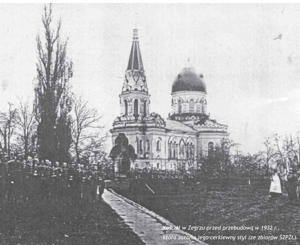
Kościół w Zegrzu przed przebudową w 1932 r., która zatarta jego cerkiewny styl

W czasie walk rosyjsko-niemieckich na jesieni 1944 r. kościoły w Zegrzu i Woli Kiełpińskiej bardzo ucierpiały. Jeśli chodzi o świątynię w Woli, to powoli przywrócono ją do dawnego stanu, natomiast uszkodzony kościół w Zegrzu nigdy nie doczekał się remontu. Po zakończeniu wojny nie było woli ani odbudowy świątyni, ani wznowienia parafii. Kres zegrzyńskiego kościoła na-