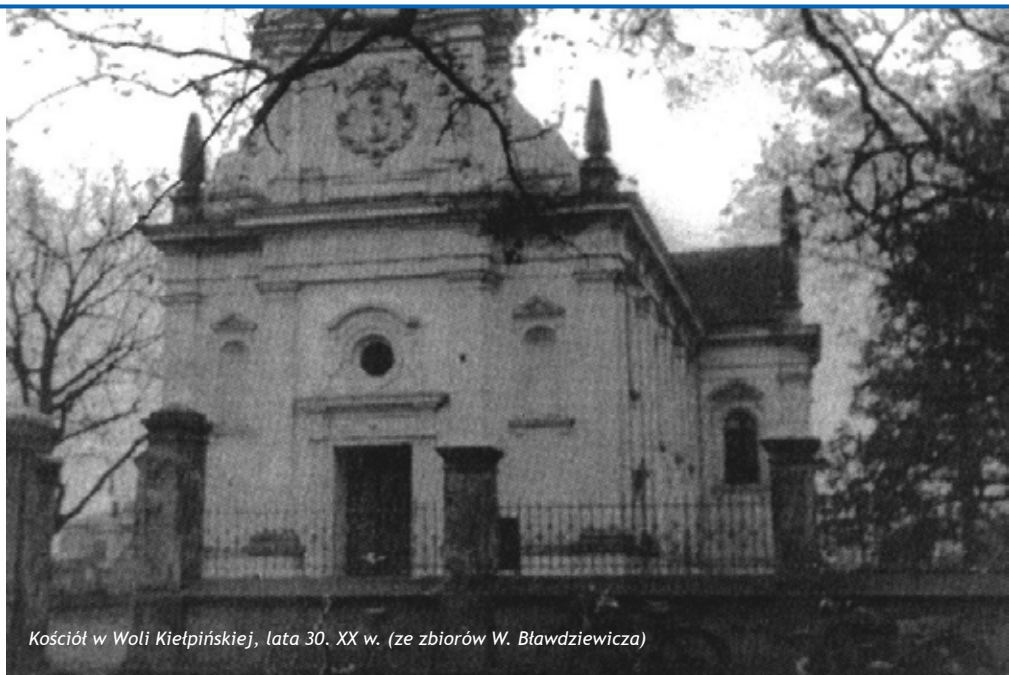
Kościół w Woli Kiełpińskiej, lata 30. XX w.