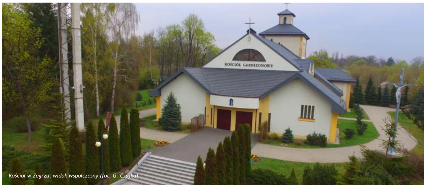
Kościół w Zegrzu, widok współczesny