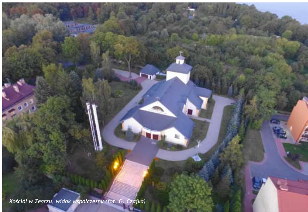
Kościół w Zegrzu, widok współczesny

Kilka lat po przemianie ustrojowej w 1989 r., w dniu 21 stycznia 1993 r. przywrócono parafię wojskową w Zegrzu i dwa miesiące później poświęcono kaplicę - salę w budynku kinoteatru na terenie Wyższej Szkoły Oficerskiej Wojsk Łączności. W 1996 r. papież Jan Paweł II poświęcił kamień węgielny pod budowę kościoła. Nie zdecydowano się jednak na odtworzenie świątyni w przedwojennej formie i w latach 1999-2003 zbudowano kościół według nowego projektu. Jego konsekracja nastąpiła 29 maja 2007 r.