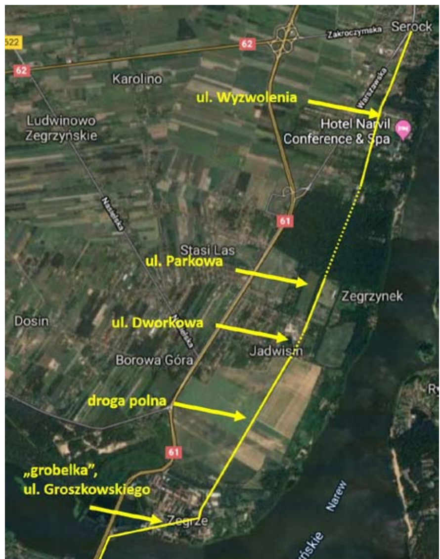
Przebieg drogi Zegrze-Serock przed wybudowaniem Traktu Kowieńskiego (przy wykorzystaniu zdjęcia satelitarne z google.com/maps)