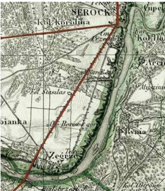
Przebieg Traktu Kowieńskiego w 1843 r. (1:126 000, Topograficzna Karta Królestwa Polskiego, sek. III [fragment], 1843, http://maps.mapywig.org )