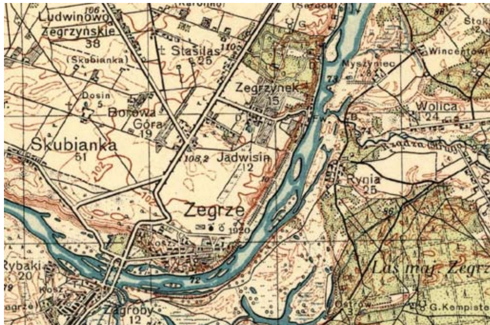
Przebieg szosy Zegrze-Serock w okolicach Zegrza w 1933 r. Widoczne ostre zakręty przy forcie w Zegrze (1:100, mapa WIG Warszawa Północ [fragment], 1933, http://maps.mapywig.org )