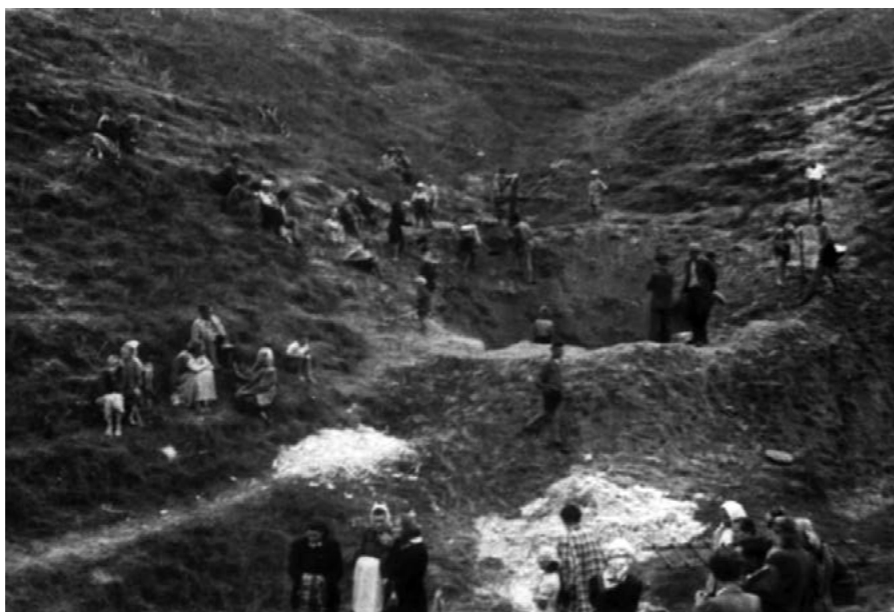
Odnalezienie grobu w wąwozie

od masowego usuwania ludności żydowskiej z Pułtuska, Serocka i Nasielska, do gett w innych częściach kraju, która to akcja została zakończona na początku grudnia 1939 r. Zastraszanie ludności polskiej miało miejsce głównie w takich formach jak: masowe egzekucje, wywożenie do obozów koncentracyjnych i wysiedlanie. Domy i gospodarstwa wysiedlonych zajmowali miejscowi volksdeutsche oraz Niemcy z krajów bałtyckich. W Serocku w grudniu wysiedlono około 150 osób i przewieziono do obozu w Działdowie, a wcześniej w kwietniu 1940 r. utworzono obóz pracy, dla osób