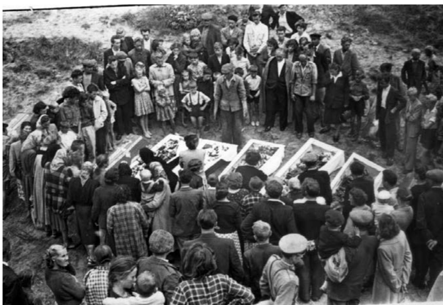
Ekshumacja w wąwozie

Chcąc zrozumieć jak doszło do tej zbrodni trzeba rozpocząć od wspomnienia, że po przegranej kampanii wrześniowej, w dniu 8 października 1939 r. na mocy dekretu Hitlera miasto Serock i gmina wiejska Żegrze wraz z większością terytorium powiatu pułtuskiego zostały włączone do tzw. rejencji ciechanowskiej. Rejencja tworzyła część Prus Południowo-Wschodnich (Süd Ostpreussen). Część powiatu, miasto Wyszaków oraz gminy wiejskie: Wyszaków i Somianka znalazły się w Generalnej Guberni. Granica policyjna i dewizowa biegła z niewielkimi odchyleniami po linii Bugu a następnie Narwi, od Jackowa Dolnego do Dębego. W związku z tym w Serocku umieszczono posterunki straży granicznej oraz żandarmerii. Germanizację ziem włączonych do Rzeszy rozpoczęto