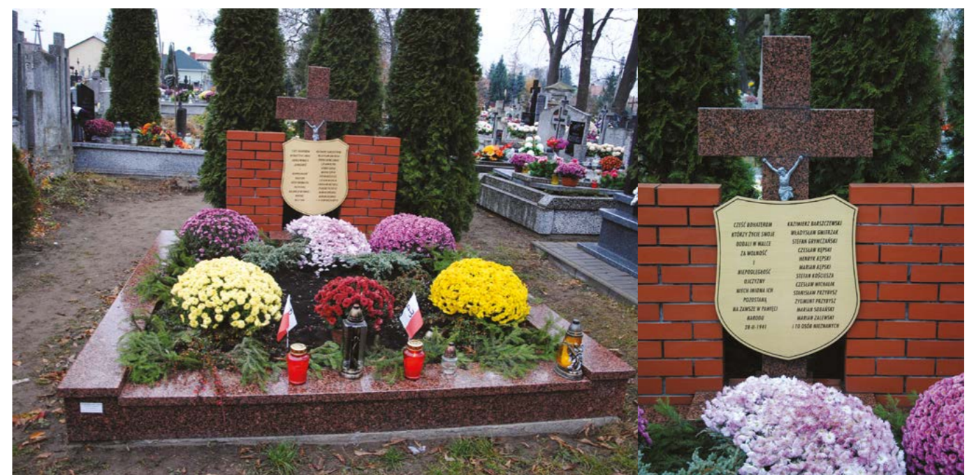
Grób pomordowanych na cmentarzu